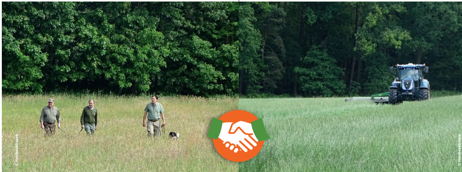
Perceel vreemd maken met honden